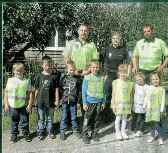
V závěru besedy s policisty všichni hezky zapózovali fotoaparátu